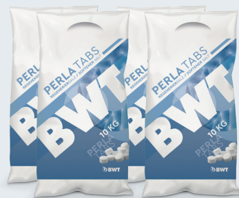
BWT Perla Tabs

➡ BWT Perla Tabs (4 × 10 kg) ➡ 4 × 3L Quantophos ➡ 1 × 20 L Quantophos ➡ 1 Stk. Refill ➡ 1 Stk. Refill