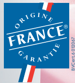
PERLA SPHÈRE XL

L'ASSURANCE DE VOTRE TRANQUILLITÉ, POUR LONGTEMPS !