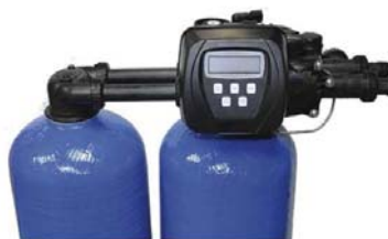
1. ábra VAD PRO kétoszlopos vízlágyító