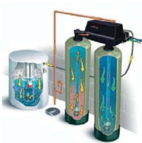
2. ábra Kétoszlopos készülék működési vázlat