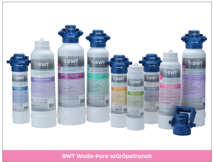
BWT Woda-Pure szűrőpatronok