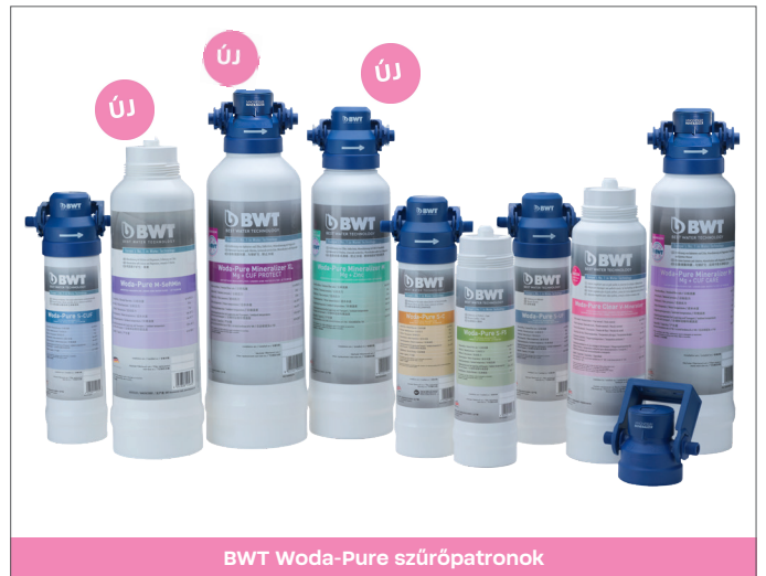
BWT Woda-Pure szűrőpatronok