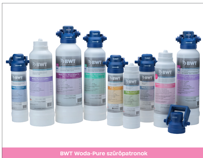
BWT Woda-Pure szűrőpatronok