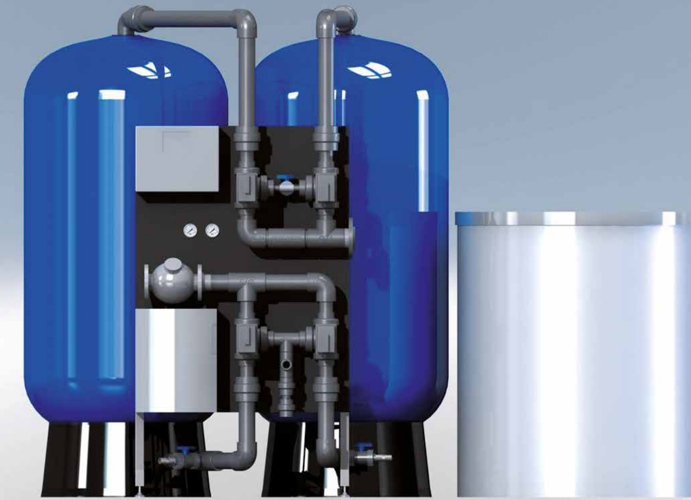
De zuinigste industriële waterontharder