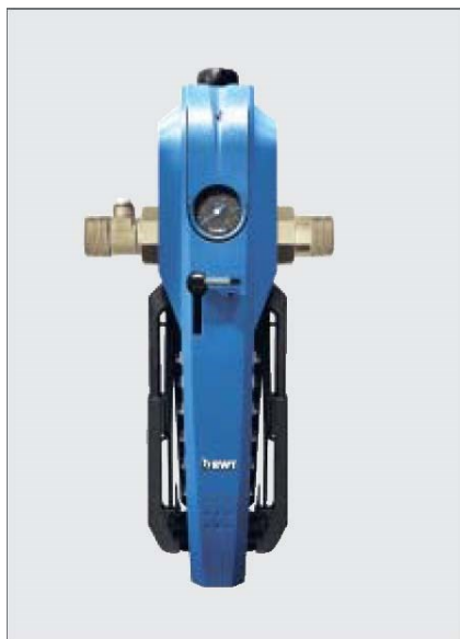
BWT E1 HWS husvannstasjon