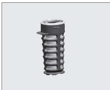
Hygieneboks i svart støttekurv Hygieneboks = hvit filterbeholder og hvit/blå filterelement